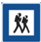
H17 lokaliseringsmärke för vandringsled.